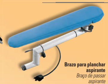
Brazo para planchar aspirante Braço de passar aspirante