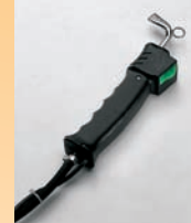
Pistola vapor - Pistola vapor